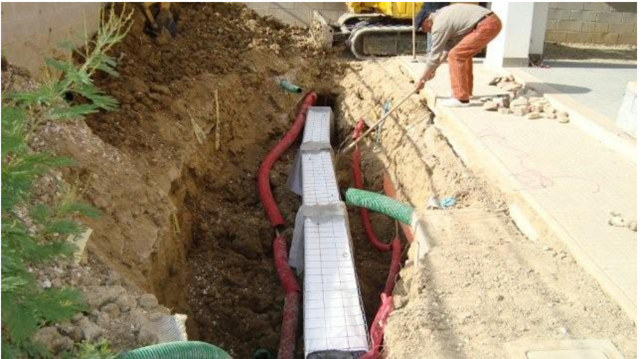
Subito dopo la posa