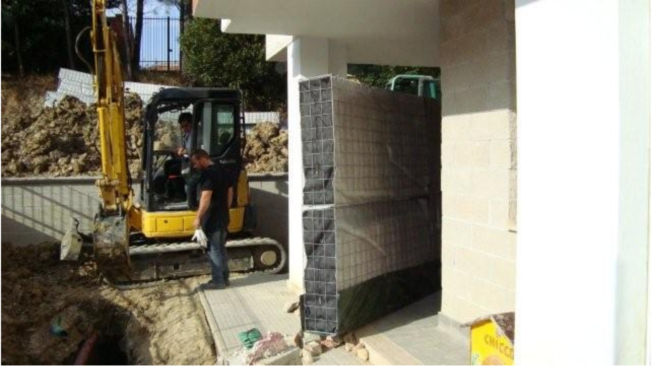
I moduli DRENTER prima della posa in trincea sottile