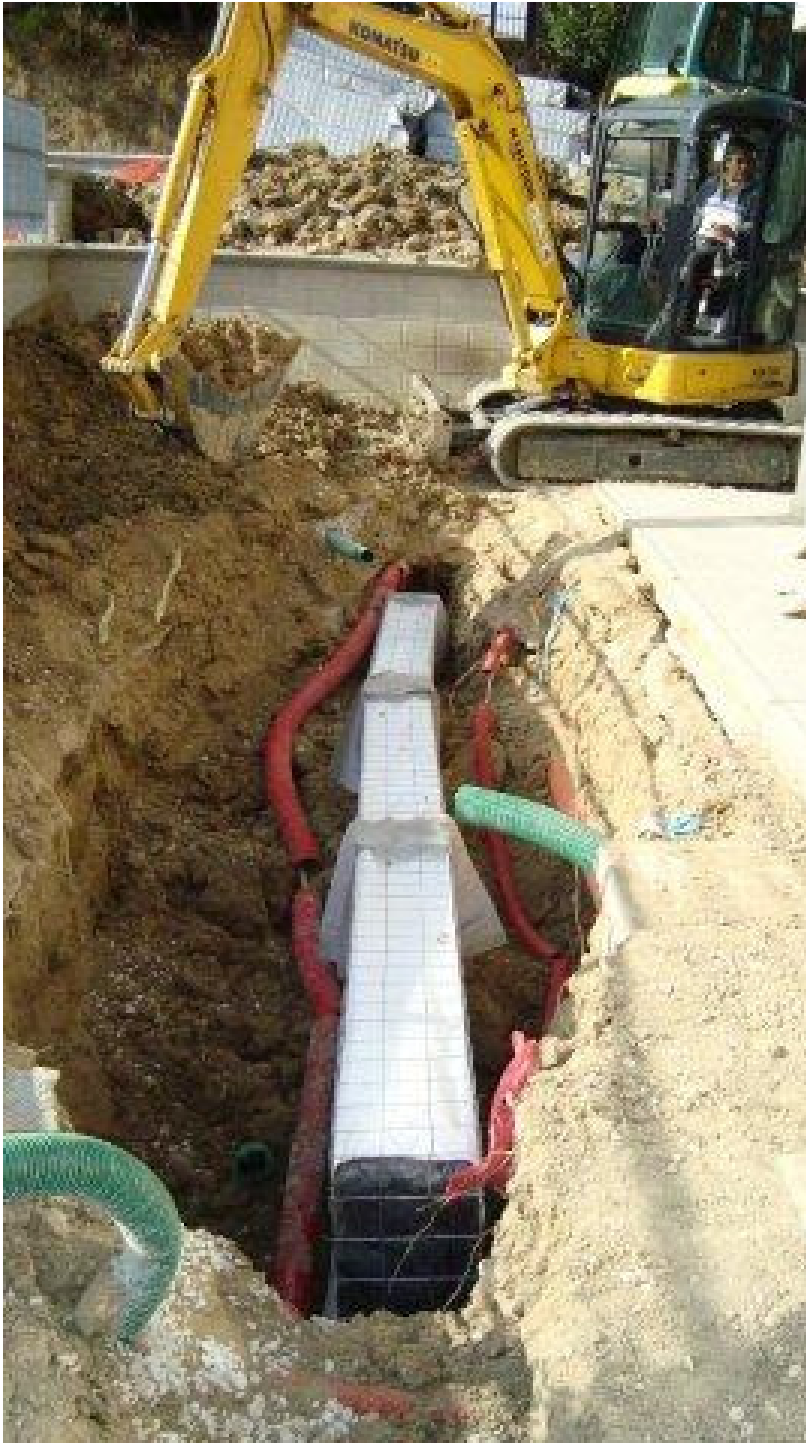
Fasi di rinterro con escavatore